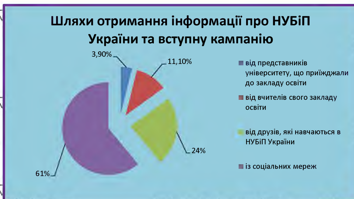
Рис. 3.1. Результати відповідей на запитання «Шляхи отримання інформації про НУБіП України»

Умови, викликані карантинними обмеженнями COVID-19 упродовж двох років, а також останні 9 місяців в умовах активної фази бойових дій жорстокої війни по всій території України, мінімізували можливості живого спілкування науково-педагогічних працівників та керівництва закладів вищої освіти із випускниками закладів загальної середньої та фахової передвищої освіти. Профорієнтаційна робота в основному звелась до онлайн-формату, що обмежило здатність представити особливості освітнього процесу та специфіку обраних вступниками спеціальностей. Дні відкритих дверей з використанням