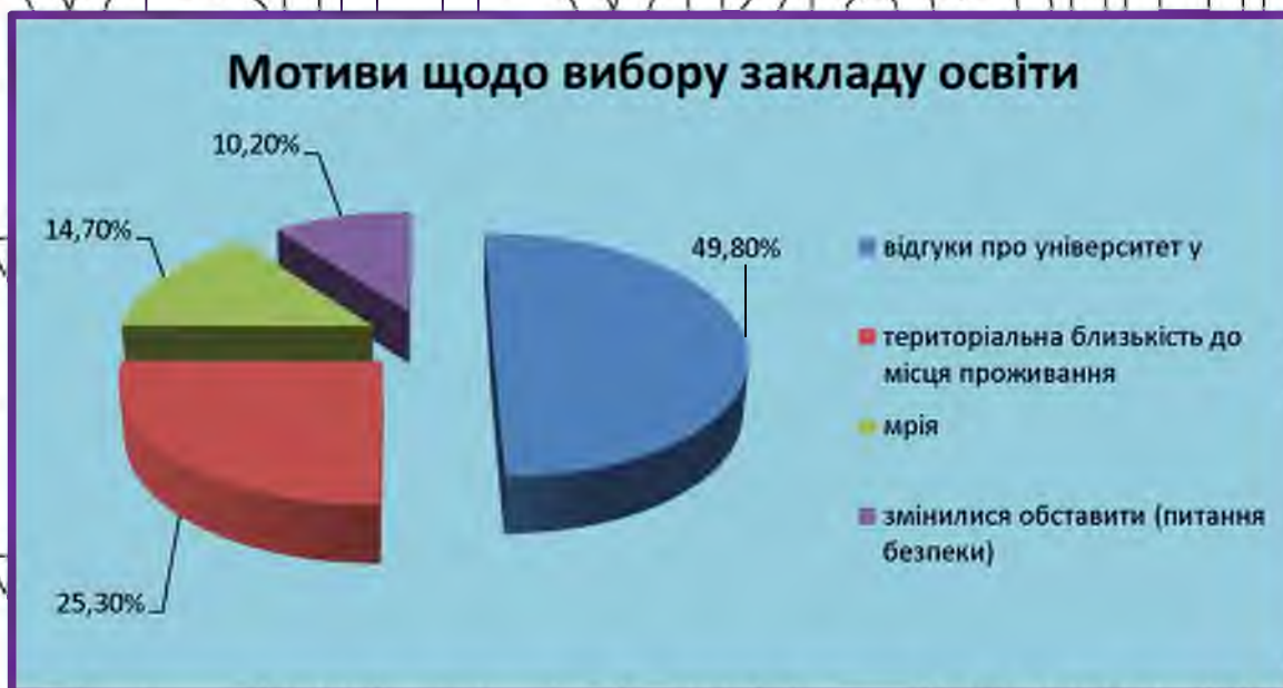
Рис. 3.2. Результати відповідей на запитання «Пріоритети, які мотивують до вибору закладу вищої освіти»

❖ зміна обставин, пов'язаних з питаннями безпеки (виїзд за кордон, рятуючись від війни, перебування на тимчасово окупованих та особливо небезпечних прифронтових територіях тощо) (10,20%) (Рис. 3.2.);