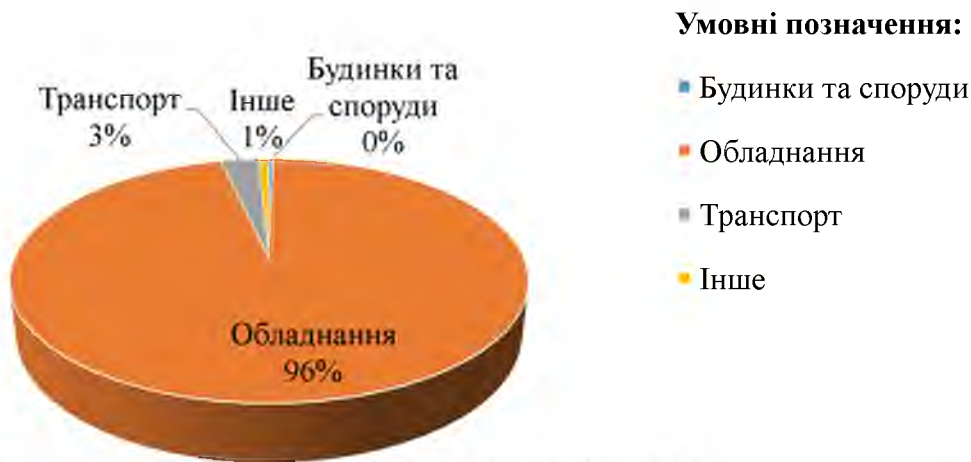
Рис.2.2. Структура основних засобів ПП «ТД Меркурій» за 2021 рік

Для кращого розуміння змін у структурі основних засобів на ПП «ТД «Меркурій»» слід розглянути також структуру минулого року (рис.2.2) провести порівняння.