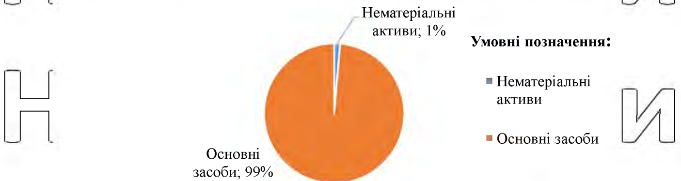
Рис.1.2. Структура необоротних активів ПП «ГД «Меркурій»»

На досліджуваному підприємстві «ГД «Меркурій»» обсяг необоротних активів підприємства у відсотковому співвідношенні майже повністю припадає на основні засоби (рис.1.2). Їх обсяг становить 99% від усіх активів або 578,9 тис. грн в грошовому виразі.