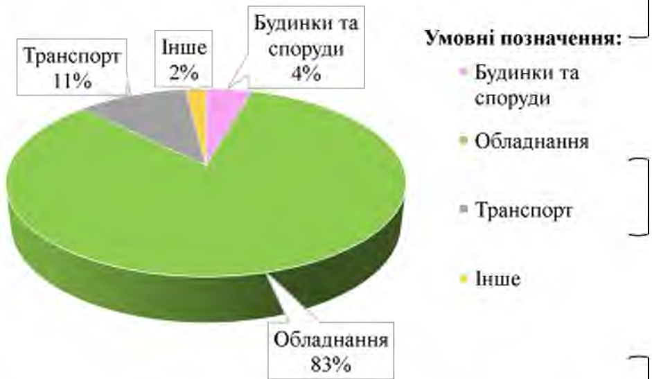
Рис.2.1. Структура основних засобів ІП «ТД «Меркурій»» на 2022 рік

Щодо майна «ТД «Меркурій»», то його значну частину складають основні засоби, структуру яких наведено нижче (рис.2.1):