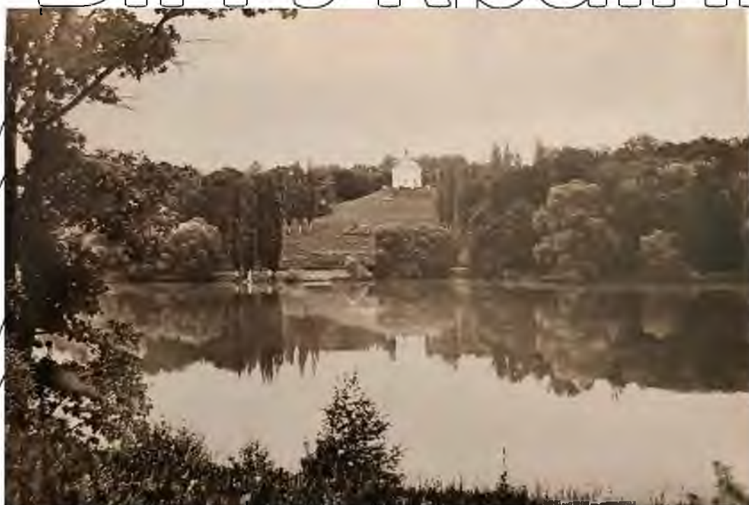
Рис. 3.1 В. Альтанка М.І. Глінки в Качанівці XIX ст.

Тут черпали натхнення для своєї творчості М. Гоголь, В. Штенберг, М. Глінка, С. Гулак-Артемовський, Марко Вовчок, П. Куліш, І. Рєпін, М. Костомаров та багато інших діячів культури, неодноразово тут бував Т.Г. Шевченко (рис. 3.1).