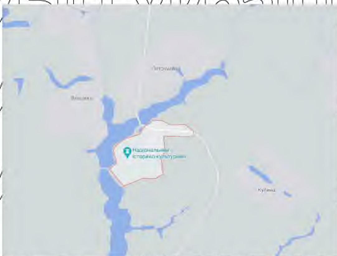
Рис. 2.1. Ситуаційний план Національного історико-культурного заповідника «Качанівка»