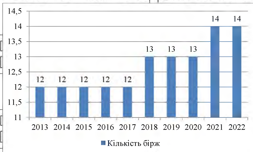
Рис. 2.1. Динаміка кількості бірж в Україні за 2013-2022 рр. [59]

його прозорість. Кількість бірж на Україні за 2013-2022 рр. має тенденцію до зростання. У 2013 році в Україні діяло 12 бірж, а у 2022 році їхня кількість збільшилася до 14 (рис. 2.1).