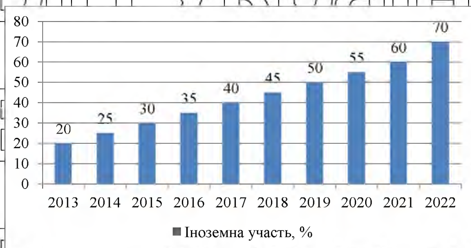
Рис. 2.4. Динаміка зміни частки участі іноземних інвесторів на українських біржах за 2013-2022 рр. (%) [59]

Іноземна участь на українських біржах також має тенденцію до зростання (рис. 2.4).