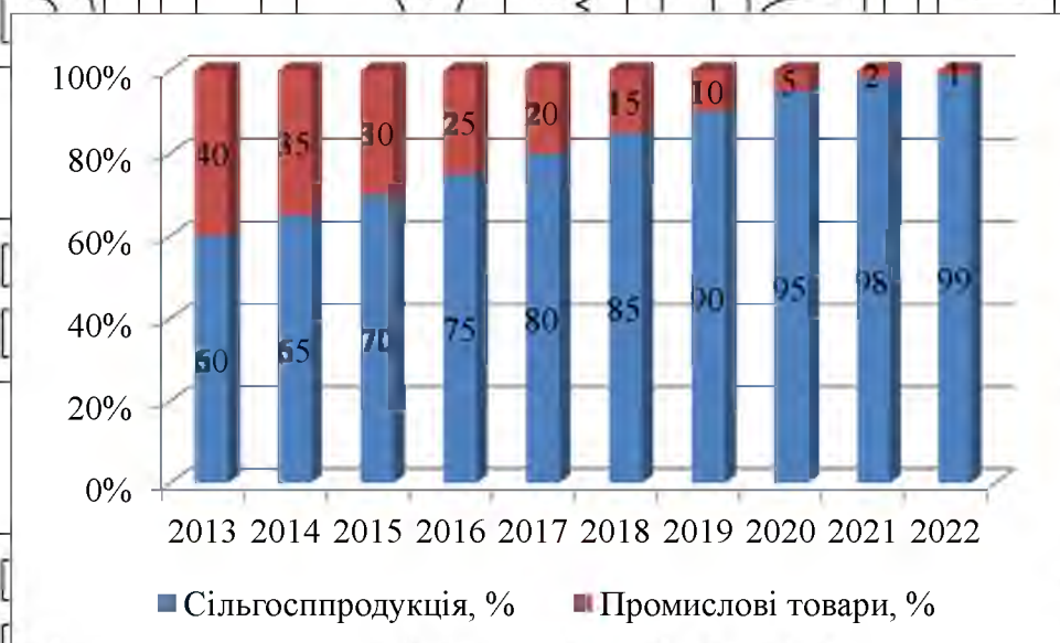
Рис. 2.3. Структура торгівлі товарами на біржовому ринку України за 2013-2022 рр. [59]

торгівлі сільгосппродукцією сприяє підвищенню прозорості та ефективності цього ринку.