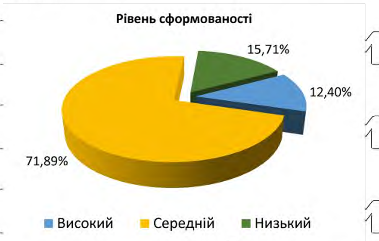
Рис. 2.1 – Рівень сформованості ціннісного ставлення до сільськогосподарської праці на констатувальному етапі дослідження

Таким чином, на підставі отриманих результатів рис. 2.1, ми можемо стверджувати, що на період проведення констатувального етапу експерименту ціннісного ставлення до сільськогосподарської праці у респондентів не сформовано.