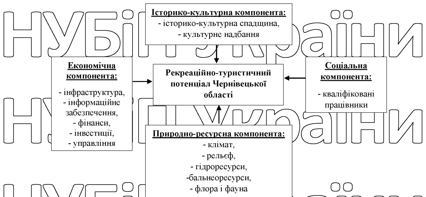
Рисунок 2.9. Компоненти рекреаційно-туристичного потенціалу Чернівецької області [51]

З іншого боку, ці обмеження створюють потребу у залученні альтернативних напрямків для задоволення зростаючих потреб.