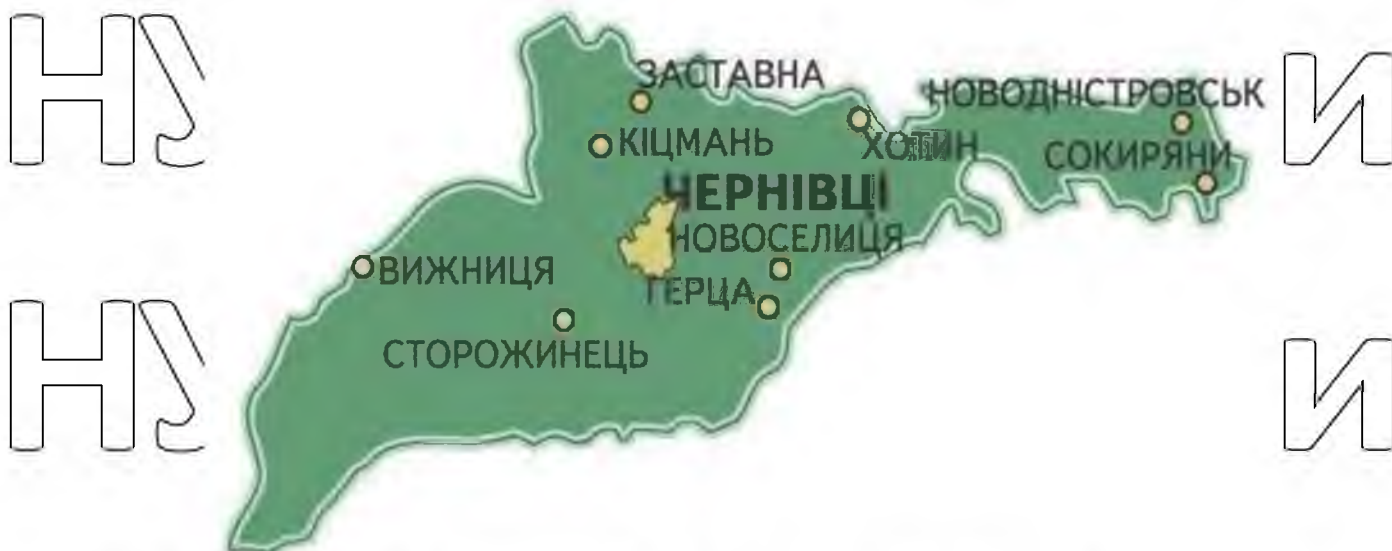
Рисунок 2.7. Карта Чернівецької області

Головними лісскладовими видами є жлина, бук, ялиця та дуб [8].