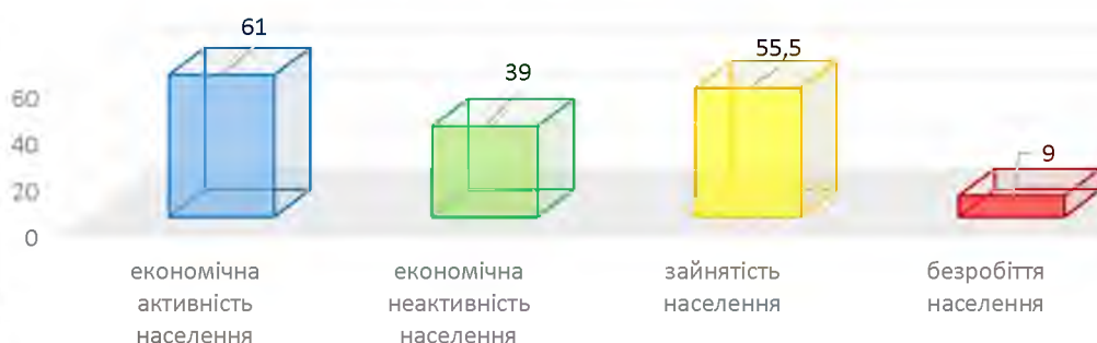
Рисунок 2.10. Економічна активність (неактивність) населення Чернівецького регіону у віці 18-70 років за 2021 р., % [37]

персонал та інші бюджетні працівники. Незважаючи на це, вони проявляють високу активність у різних видів розваг, екскурсійної діяльності, відпочинку і придбання малих сувенірів. Вони становлять найбільший сегмент споживачів рекреаційно-туристичних послуг у міжнародному туристичному обміні.