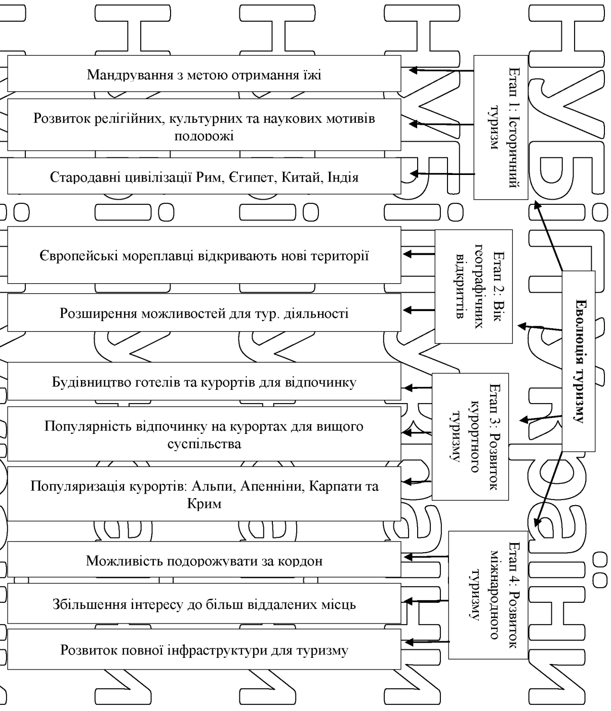
Рисунок 1.1. Етапи еволюції туризму

належного управління та маркетингу туристичного потенціалу.