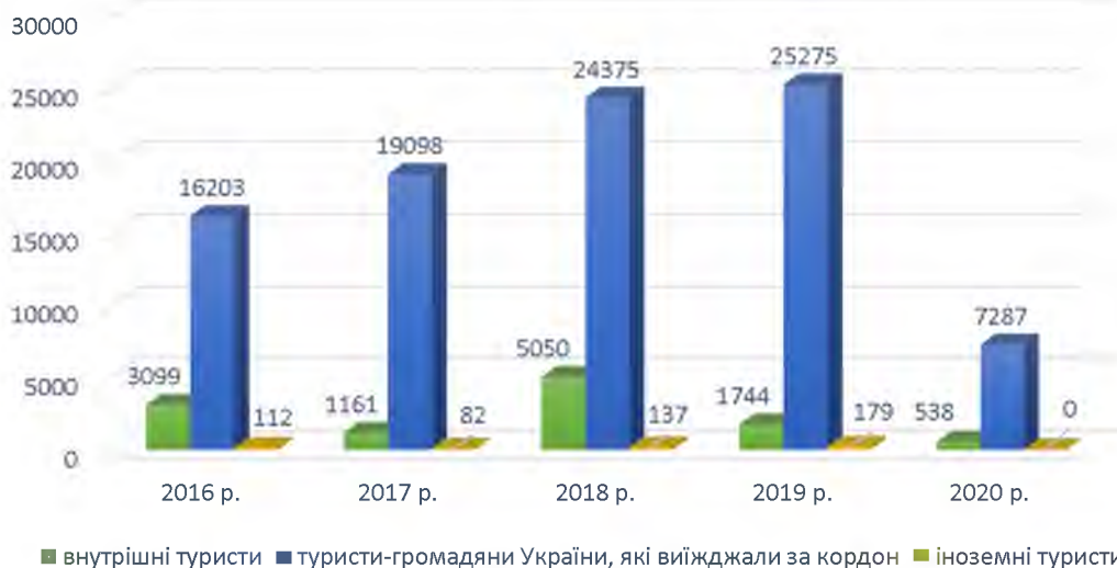
Рисунок 2.8. Туристичні потоки Чернівецької області за 2016-2020 рр. [56]

Далі проаналізуємо основні показники діяльності туристичної галузі