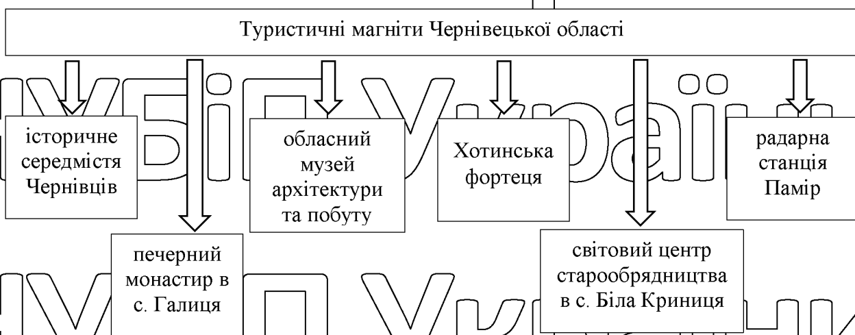
Рисунок 3.1. «Туристичні магніти» Чернівецької області [34]

їхнього розвитку. У Чернівецькій області є шість ключових «привабливих туристичних об'єктів», які представлені на рисунку 3.1.