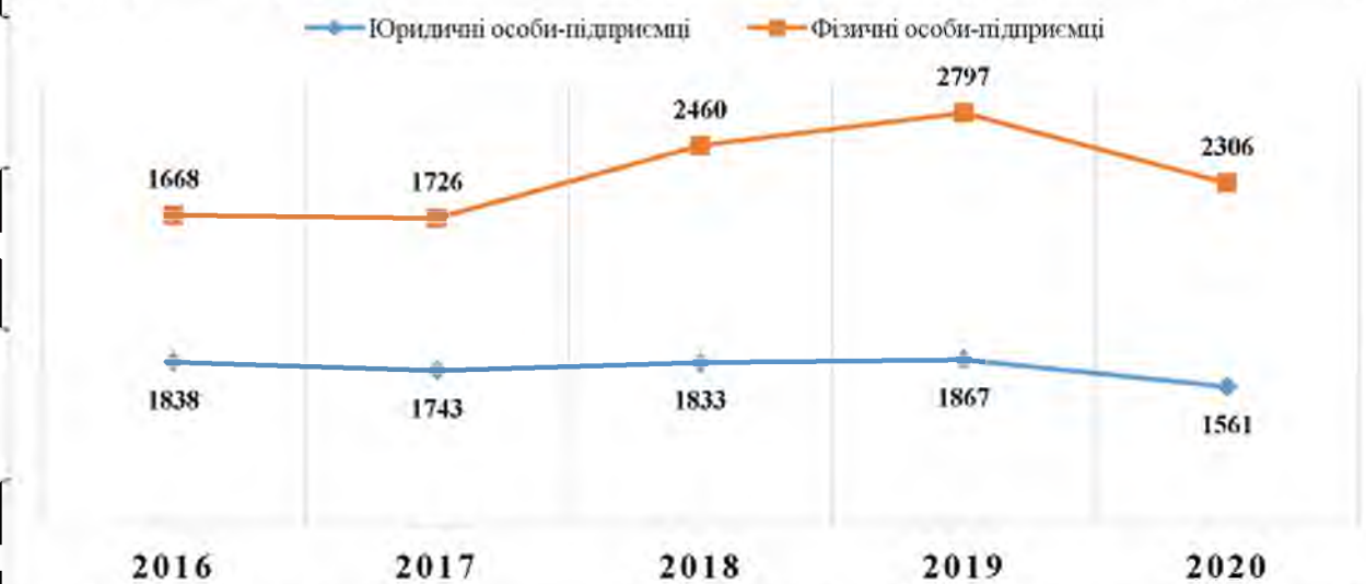
Рисунок 2.3. Кількість суб'єктів туристичної діяльності в Україні, одиниць [56]

Розглядаючи туристичний ринок України, проаналізуємо як кількість суб'єктів туристичної діяльності, так і їхні результати роботи (див. рис. 2.3).