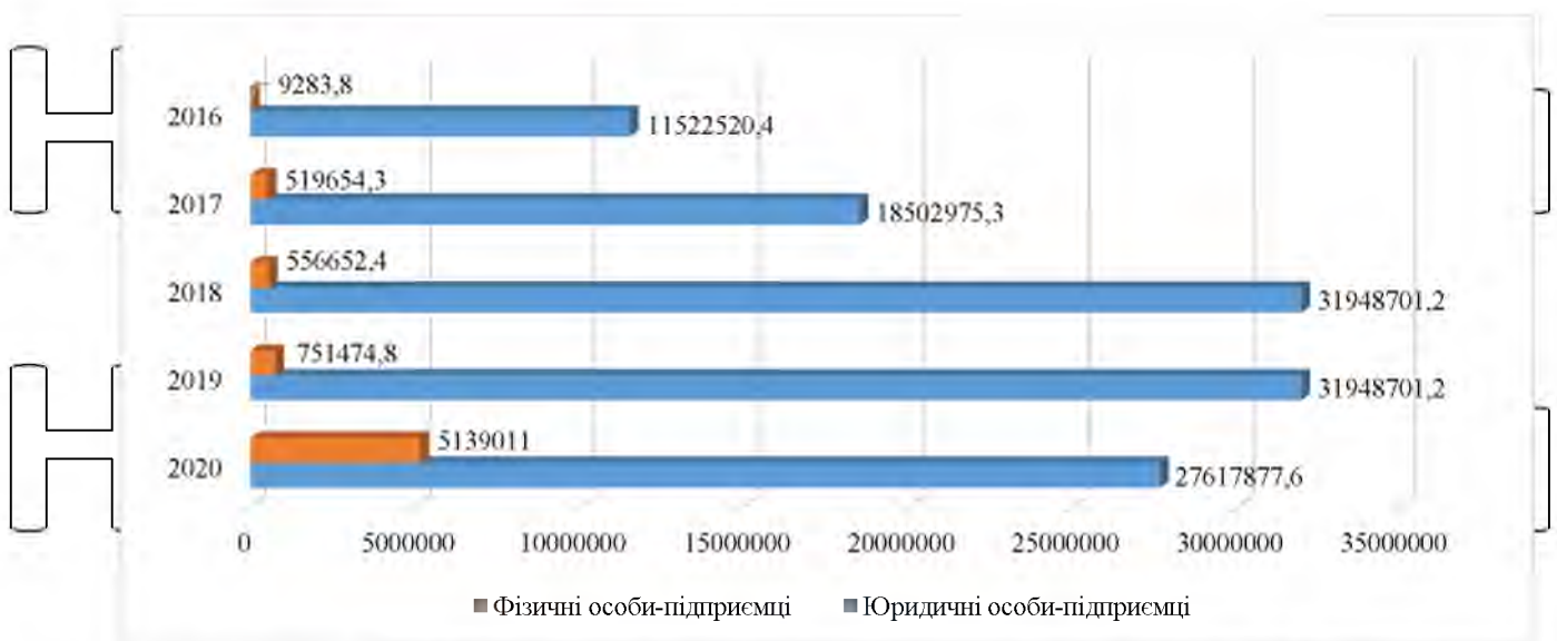
Рисунок 2.4. Дохід від надання туристичних послуг в Україні, млн. грн [56]

Також позитивними зрушеннями характеризувалися і доходи фізичних осіб (туристичних агентів та суб'єктів, що здійснюють екскурсійну діяльність), що у 2020 році зросли у понад 6 разів, у порівнянні з попередніми роками.