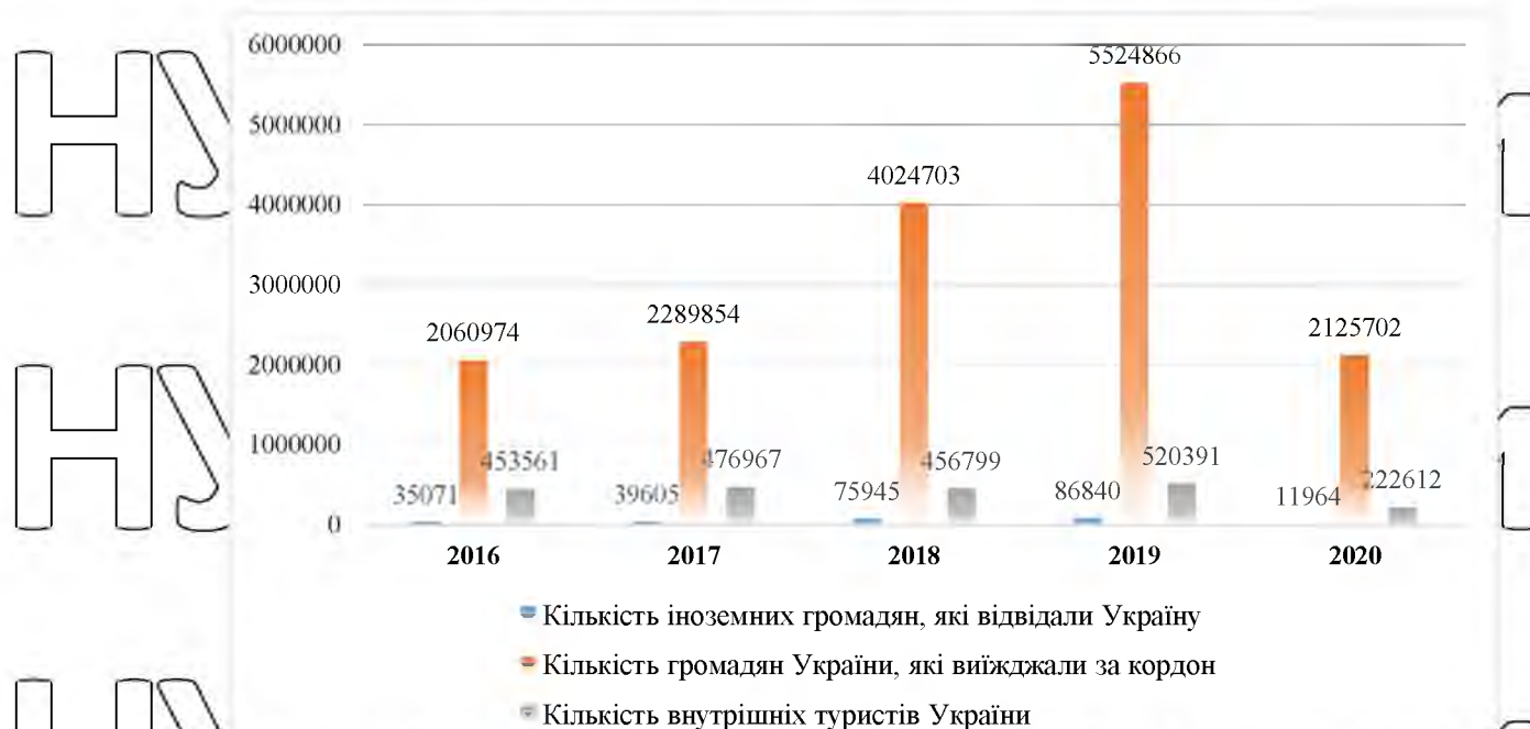
Рисунок 2.2. Динаміка туристичних потоків України, осіб [56]

При проведенні аналізу глобальних туристичних потоків, звернемо свою увагу також на даний показник у контексті України (див. рис. 2.2).