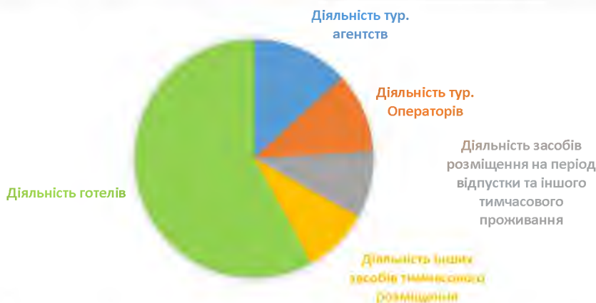
Рисунок 2.6. Доля податкових надходжень до бюджету України в кожному кодів видів економічної діяльності (КВЕД) у сфері туризму [12]

Доходи, отримані від діяльності туристичних агентств, які сплатили податки у державний бюджет у 2022 році в розмірі 204 мільйони 795 тисяч гривень, також скоротилися на 27% порівняно з 2021 роком, коли вони забезпечили бюджет держави сумою 279 мільйонів 265 тисяч гривень (див. рис 2.6).