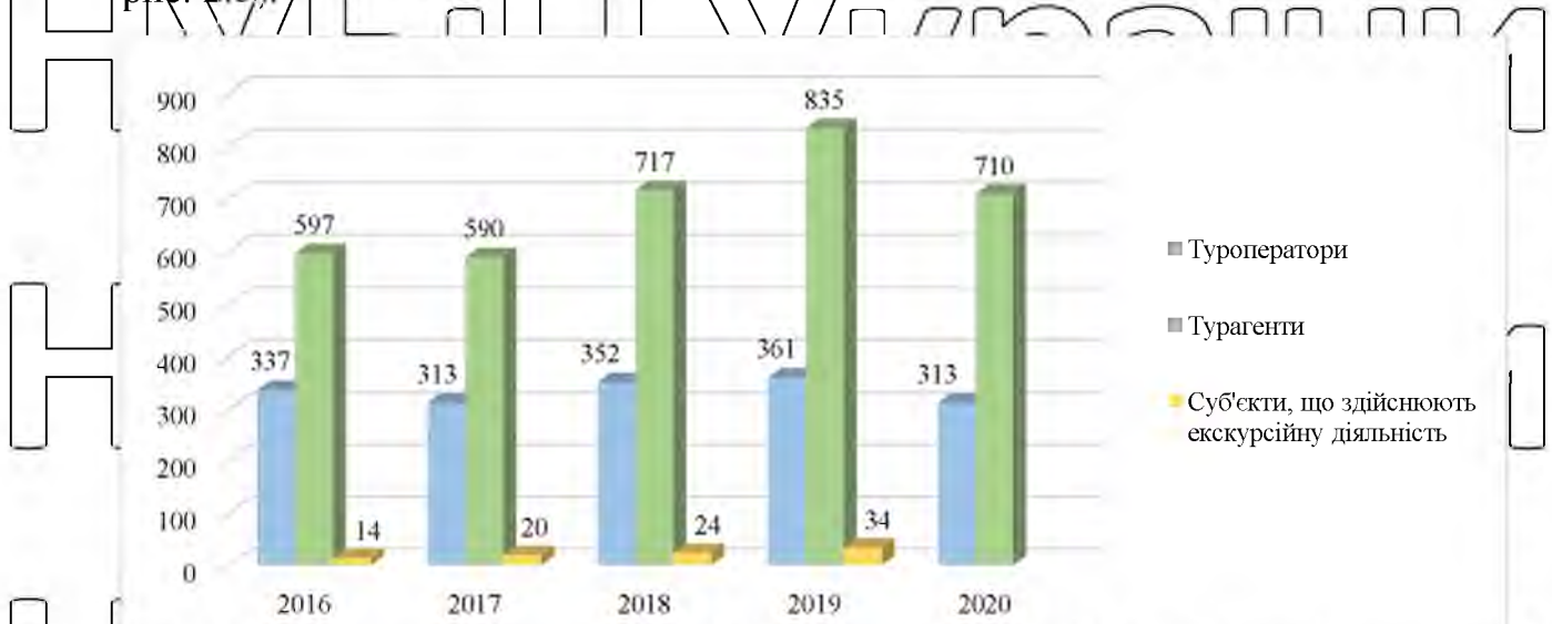
Рисунок 2.5. Динаміка суб'єктів туристичної діяльності у м. Києві, одиниць [56]