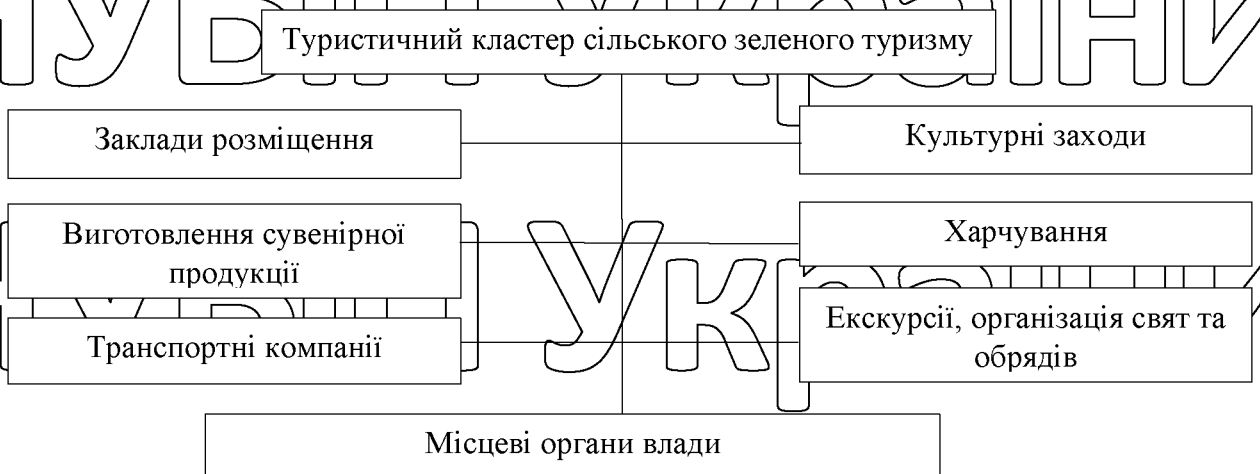
Рисунок 3.3. Структура туристичного кластеру сільського зеленого туризму Чернівецької області

туристичного кластера для Чернівецької області наведена на рисунку 3.3.