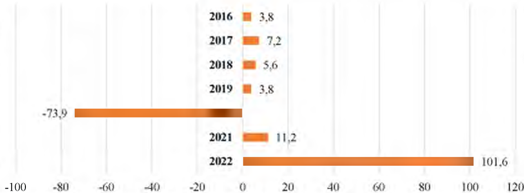
Рисунок. 2.1. Динаміка зміни міжнародних туристичних потоків, % [65]

За світовими тенденціями розвитку туризму виокремлюється зростання його ролі як на місцевому рівні, так і в глобальному масштабі. Протягом періоду з 2016 по 2019 роки, міжнародні туристичні потоки характеризувалися переважно позитивними змінами (див. рис. 2.1).