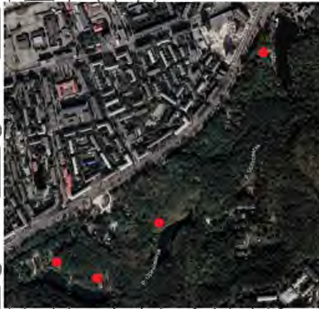
Рис. 3.1.5 Ставни на річці Оріхуватка у Голосіївському парку імені м. Рильського.