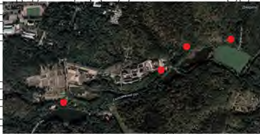
Рис. 3.1.6 Ставки на струмку Голосіївському у Голосіївському лісі.

Китаївський каскад ставків знаходиться в східній частині Голосіївського лісу. На північ від каскаду розташована територія Свято-Троїцького монастиря. Площа ставків Китаївського каскаду – від 1 до 1,6 га.