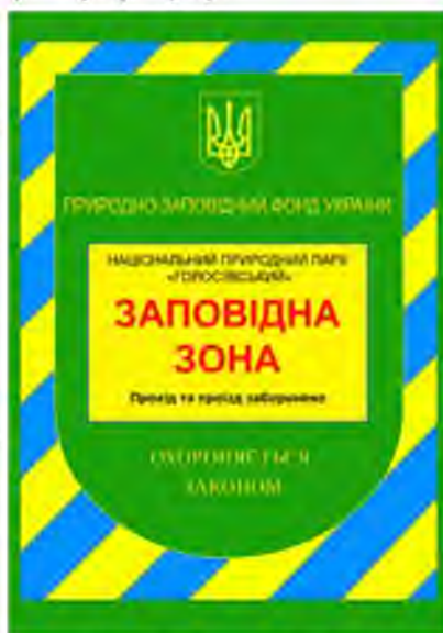
Рис. 2.2.4 Інформаційний знак про початок заповідної зони.

Територія парку включає в себе річку Віта, струмки Китаївський, Гелосіївський (Дідорівський), Геріхуватський із каскадами ставків, озеро Шапарня, а також річки басейну Ірпені в північній частині парку – Нивка, Любка, Горішка з притокою Когурка.